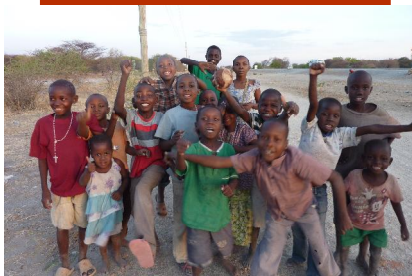
I bambini del villaggio

mana. La sua presenza è di fondamentale importanza sia per i pazienti che per le Suore: ad oggi, il governo tanzaniano non permette più di tenere aperto un dispensario con la sola presenza di infermieri, anche se esperti.