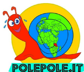
Il nostro logo